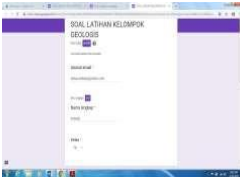
Gambar 3 Tampilan Digital Assesment

Metode yang digunakan peneliti dalam penelitian ini adalah Penelitian Tindakan Kelas (PTK). Model PTK yang peneliti gunakan adalah model Kemmis and Taggart dalam Taniredja (2010) digambarkan sebagai berikut.