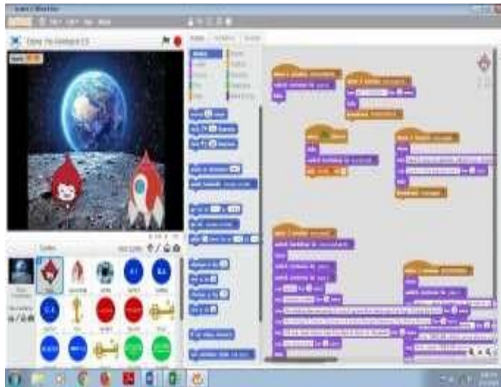
Gambar 2 Tampilan Digital Pre-Historic