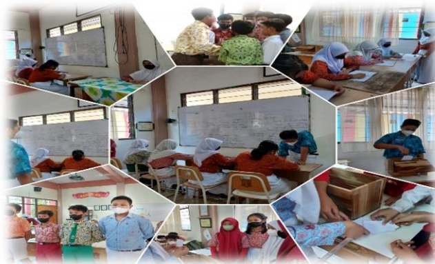
Gambar 5. Pelaksanaan Simulasi Pemilihan Ketua dan Wakil OSIS