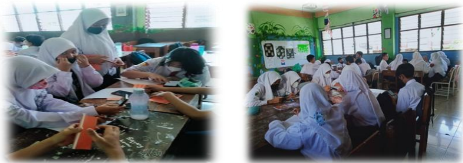
Gambar 4. Bekerja Menyelesaikan Proyek Penugasan dalam Kelompok Melalui Tutor Sebaya.

Berikut adalah dokumentasi siklus 2 Penyajian video pemilihan Ketua dan Wakil OSIS dengan perlakuan tutor sebaya.