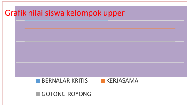
Gambar 1. Grafik Nilai Kelompok Siswa Upper