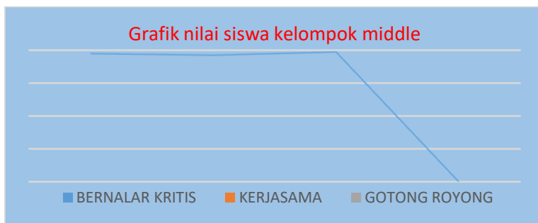
Gambar 2. Grafik Nilai Kelompok Siswa Middle

Pada siklus 2 seluruh siswa dengan kategori upper (atas = 30 siswa) mendapatkan deskripsi nilai sudah berkembang, tidak ada kelompok middle dan tidak ada kelompok siswa lower . Rentang nilai dan pengategorianya adalah (a) sudah berkembang untuk nilai 80-100; (b) mulai berkembang untuk nilai (60-79); (c) belum berkembang untuk nilai 0-59. Sedangkan nilai tuntas bila memenuhi minimal 80.